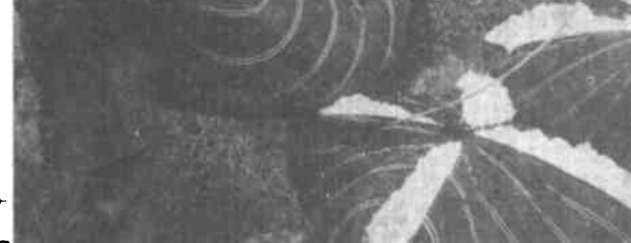
陈庄镇“三大”开发掀起高潮

万亩开发中按照“四高、八化”的质量标准，全党动员，全民参战，奋战100天，全面完成开发任务。凡出力吃住在工地，实行军事化管理。为加快开发进度，保证工程质量，该镇对分包单位制定了奖惩激励政策；各部门积极支持开发，形成了良好的氛围。在科技开发中，利用县、乡两级党校以组织轮训班、学习班等形式，分期分批地进行培训；一般党员干部的学习由各单位具体组织。广播、电视等新闻媒体开辟专栏，宣传六中全会精神，以形成浓厚的学习氛围。同时，狠抓落实，推进精神文明建设的各项工作。该县把学习贯彻六中全会精神与县实际情况相结合，搞好“五个结合”，一是与农村精神文明建设“三加一”基础工程相结合；二是与开展城镇综合治理相结合；三是与城镇居民争创“新风户”活动相结合；四是与党员干部争做“人民好公仆”相结合；五是与窗口行业推行“社会服务承诺制”相结合。(徐晓冰 彭建新 李军章)