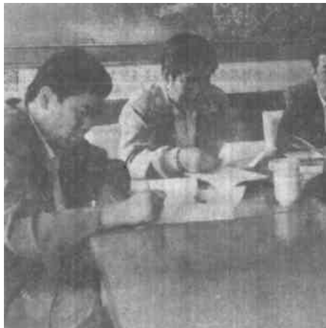
多年来，垦利县油区办领导努力加强自身建设，不断提高队伍素质，为进一步做好油区工作奠定了坚实的基础，各项工作迈上新台阶。图为党组成员在研究工作。