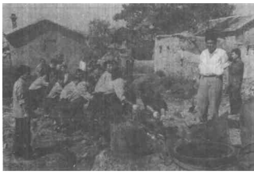
在油区社会治安综合治理中，垦利县油区办积极工作，严格执法，维护了国家利益。图为组织稽查队员取缔非法土炼油。

几年来，我们垦利县胜坨镇工农积极响应市、县提出的建设油洲加绿洲号召，坚持油地地方一起上，油田发展我发展、我与油田共繁荣的指导思想，服务油田建设，增进工农团结，推动了油田和地方农业生产的同步发展。