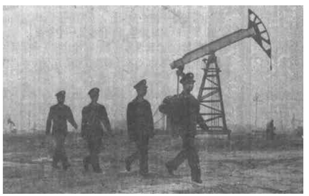
油区治安治理是一项长期的、艰巨的任务，垦利县油区办把矿井巡逻做为该项工作的突破口，常抓不懈。图为巡逻在矿井上的稽查队员。